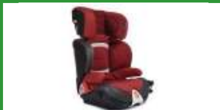
Автокресло группы III для детей массой 22-36 кг (возможно использование бустера)