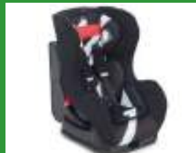
Автокресло группы I для детей массой 9-18 кг