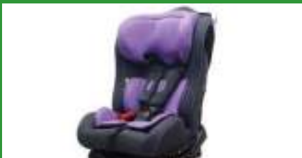
Автокресло группы II для детей массой 15-25 кг