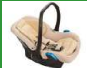
Автокресло группы 0+ для детей массой менее 13 кг